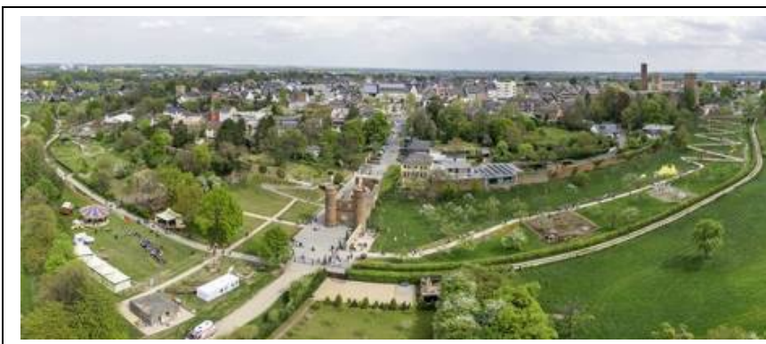
Park am Wallgraben

Nach etwa 1stündiger Fahrt waren wir schon am Ziel, und die Gruppe sortierte sich ziemlich zügig und je nach Lust und Laune in das weitläufige Parkgelände, galt es doch, ein reichhaltiges Angebot auszukundschaften: