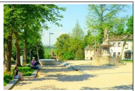
Marktplatz von Zülpich

Die Konzeption der Anlagen mit Seepark, Park am Wallgraben und der Historischen Altstadt haben unsere Mitgereisten überwiegend als gelungen empfunden.